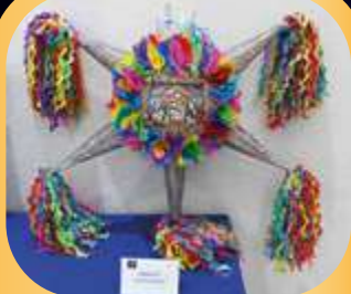
Equipo "Los Chavelitos".