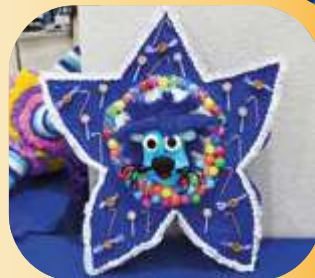
Equipo "Estrella de guía".

¡Agradecemos su participación y el interés por preservar nuestras tradiciones!