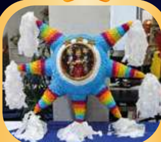
Equipo "Luz de Belén".