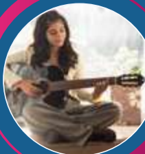
GUIARRA Viernes 4:00 a 6:00 p.m.