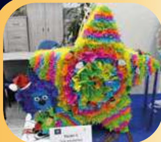
Equipo "Los ayudantes de Santa".