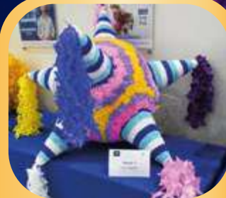
Equipo "Los Socios".